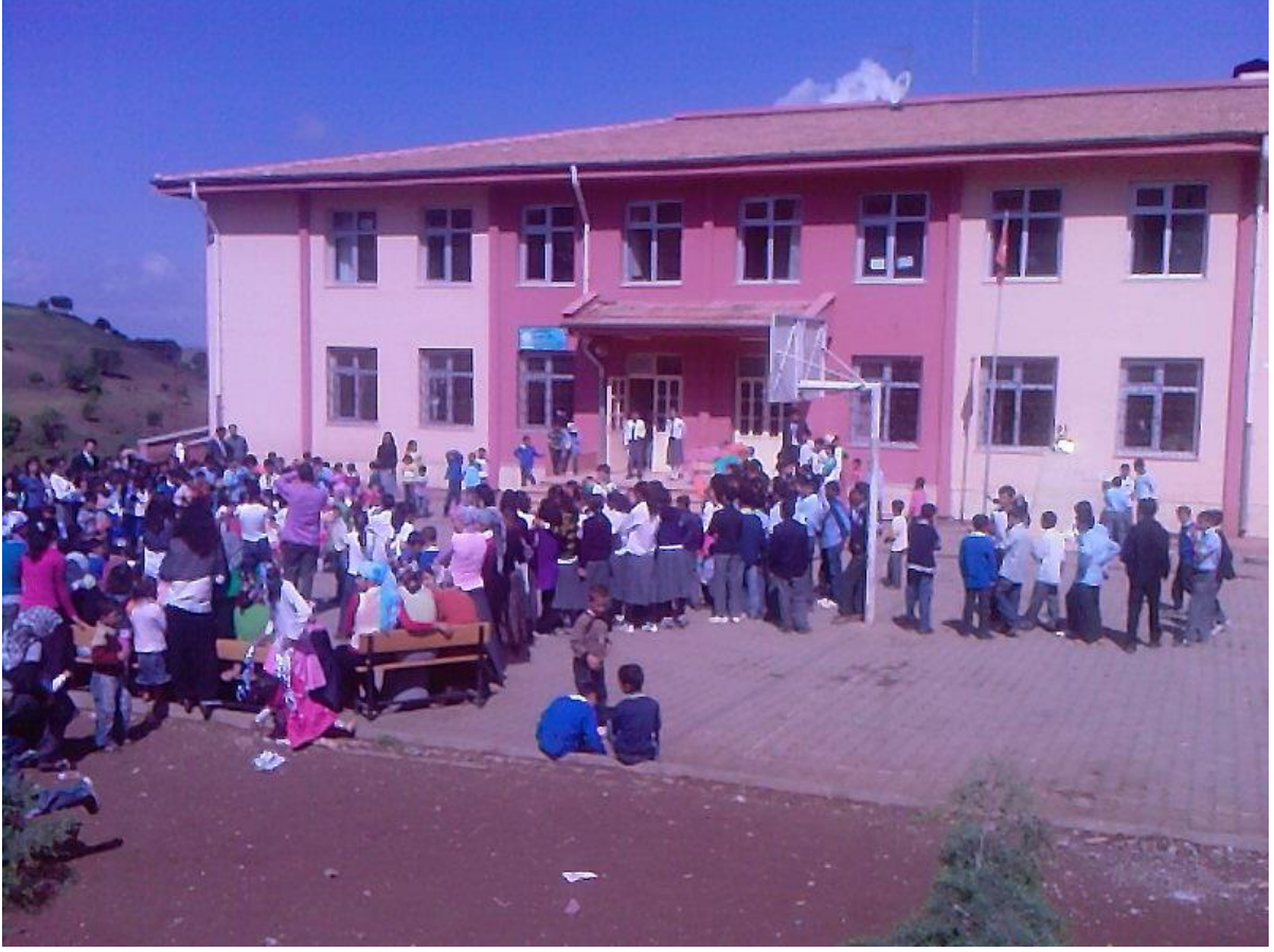
23 NİSAN KUTLAMALARINDAN BİR KESİT